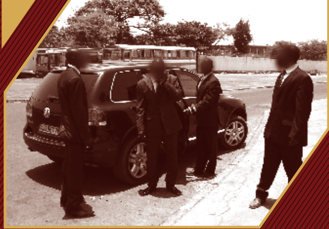
Wady France Conseil

« Savoir se protéger, c'est avant tout savoir s'entourer... »