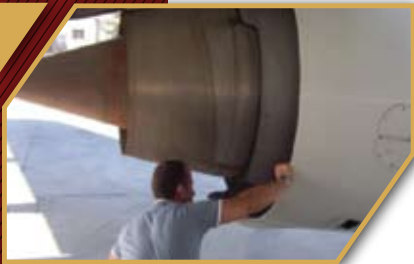
Contrat de sécurité avec AERIS